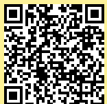
Nah am Wasser Prospekt